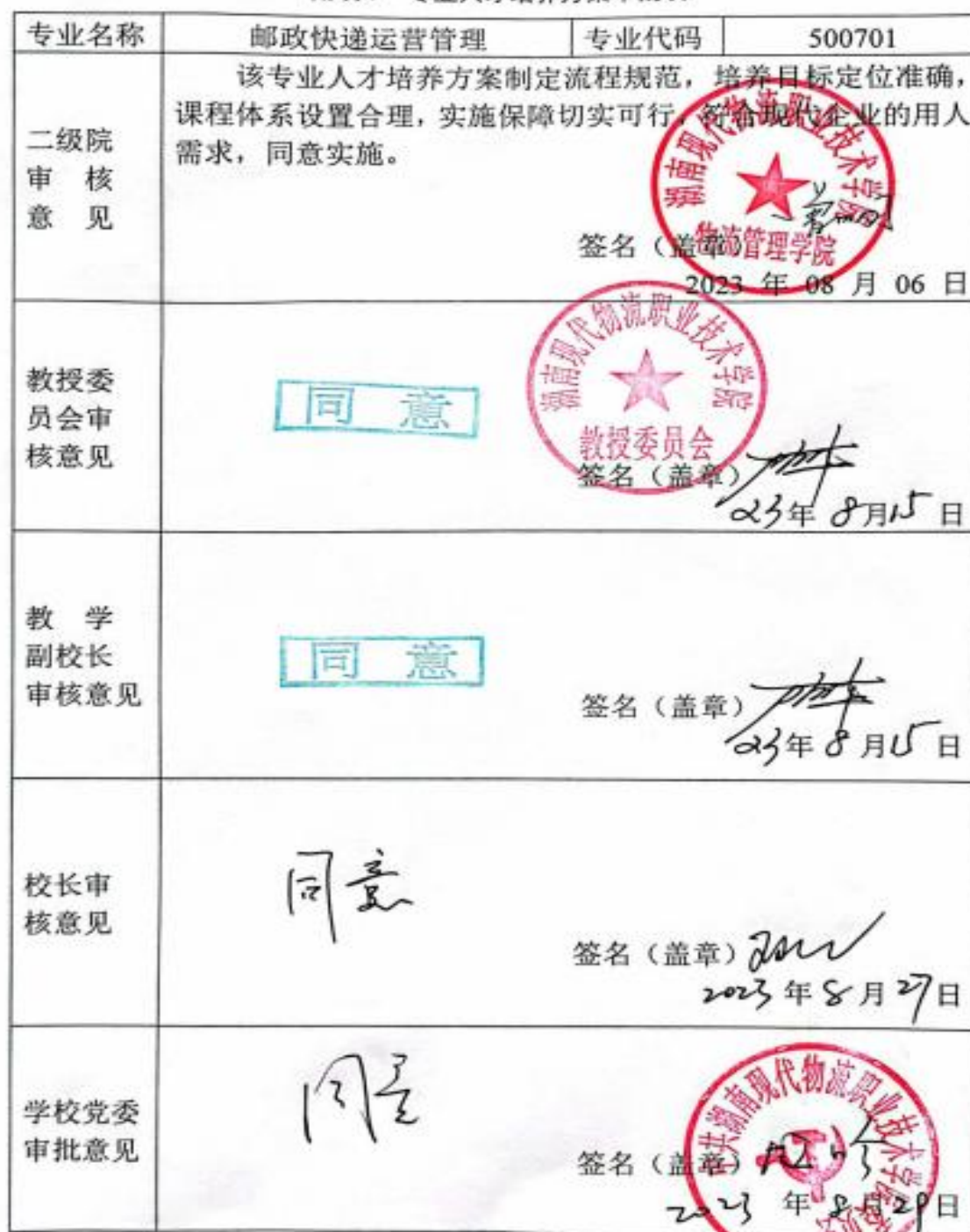
附表 7 专业人才培养方案审批表