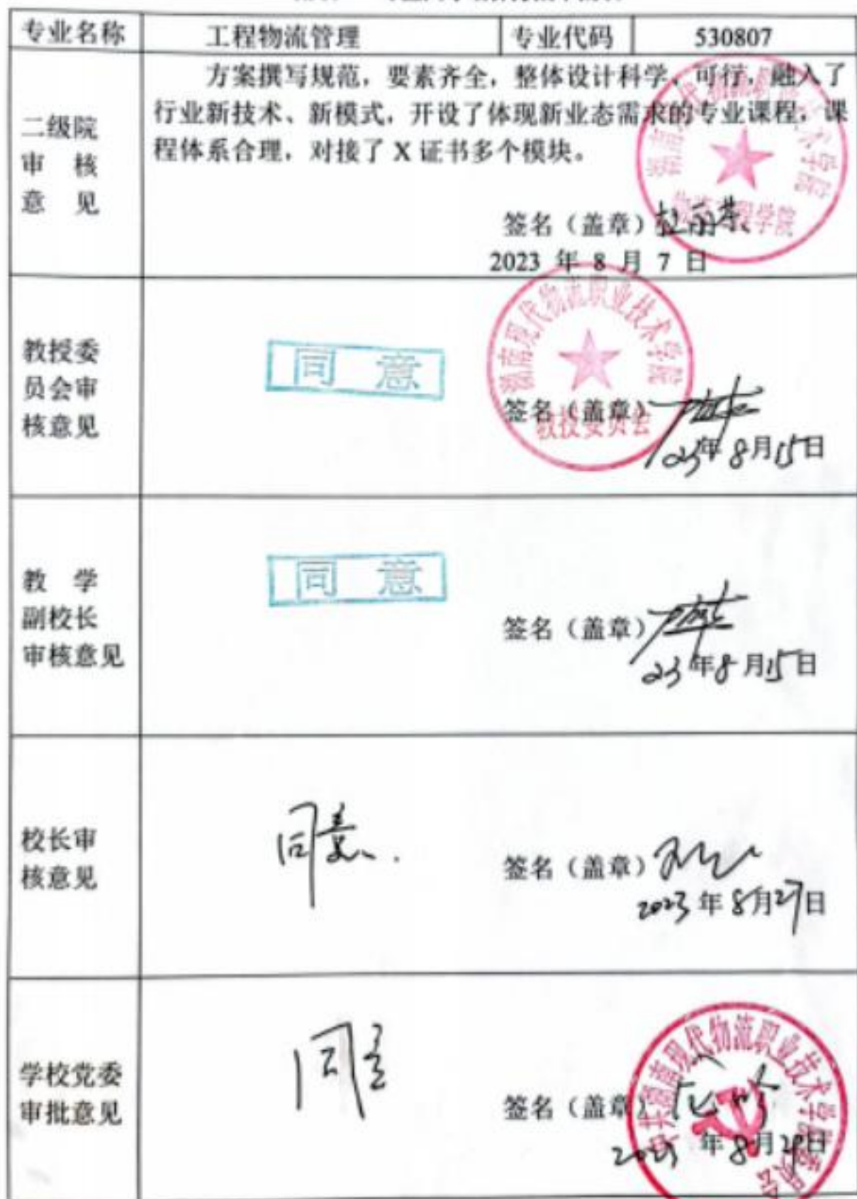
附表7 专业人才培养方案审批表