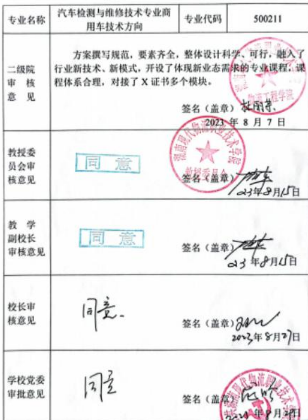
附表7 专业人才培养方案审批表